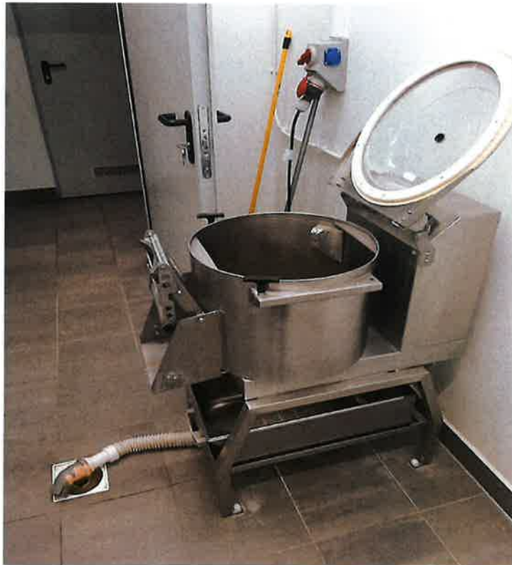
Wyposażenie i montaż urządzeń na kuchni w Zespole Oświatowym w Krześlinie.