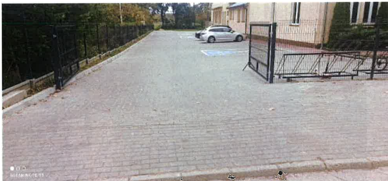
Przebudowa bramy wjazdowej do Szkoły Podstawowej w Krynicy.