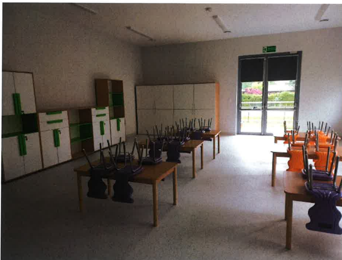
Rozbudowa Szkoły Podstawowej w Krynicy.