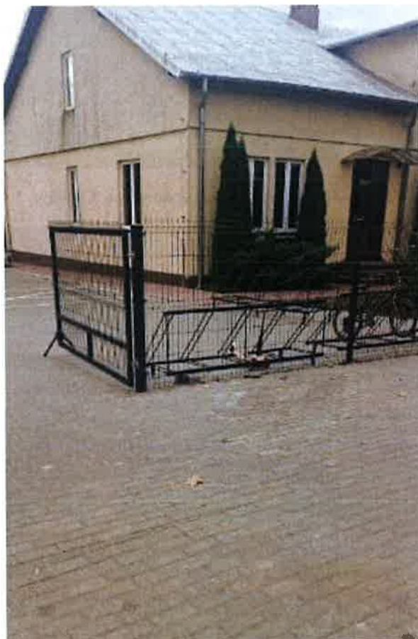
Przebudowa bramy wjazdowej do Szkoły Podstawowej w Krynicy.