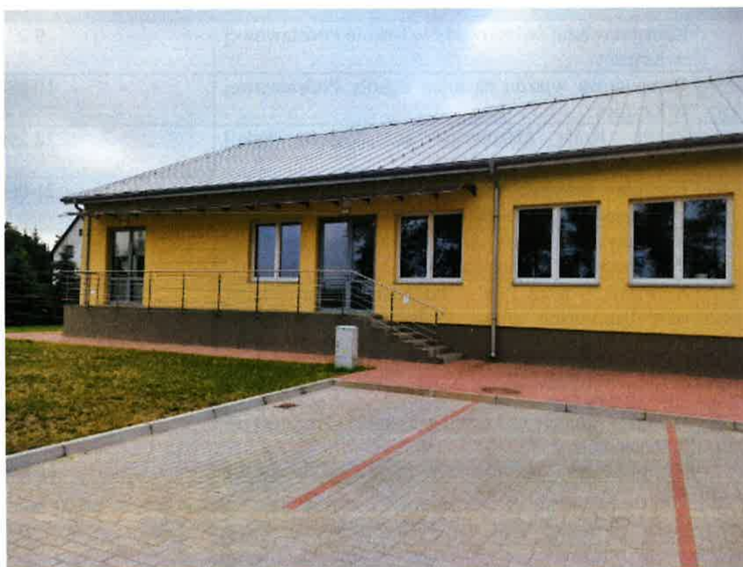
Rozbudowa Szkoły Podstawowej w Krynicy.