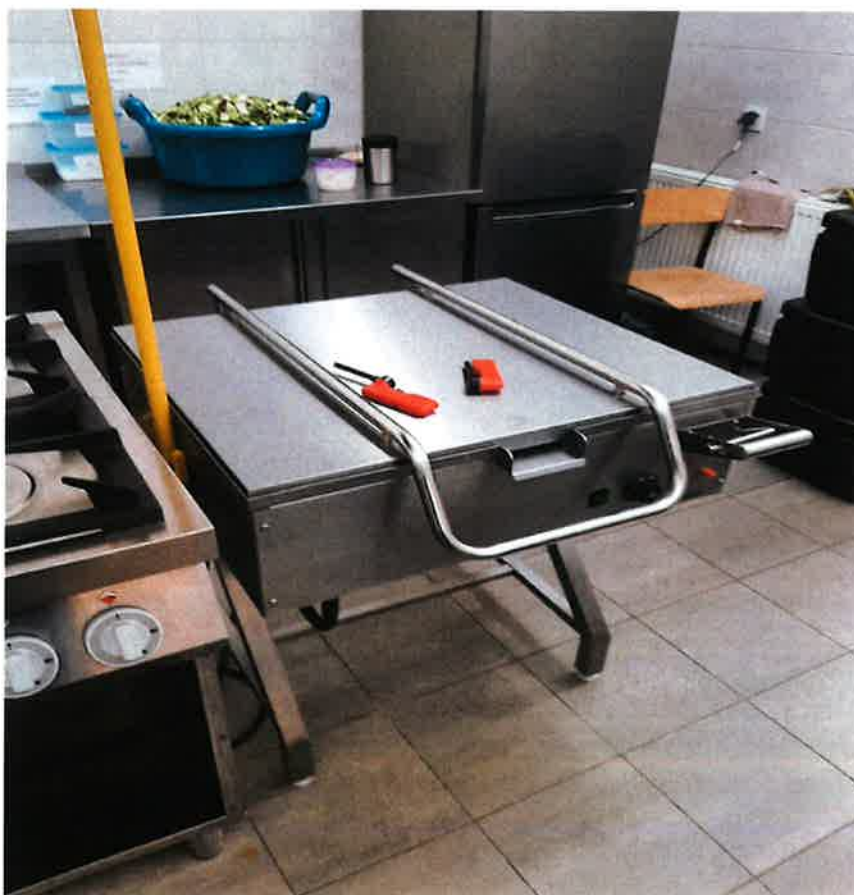
Wyposażenie i montaż urządzeń na kuchni w Zespole Oświatowym w Krześlinie.