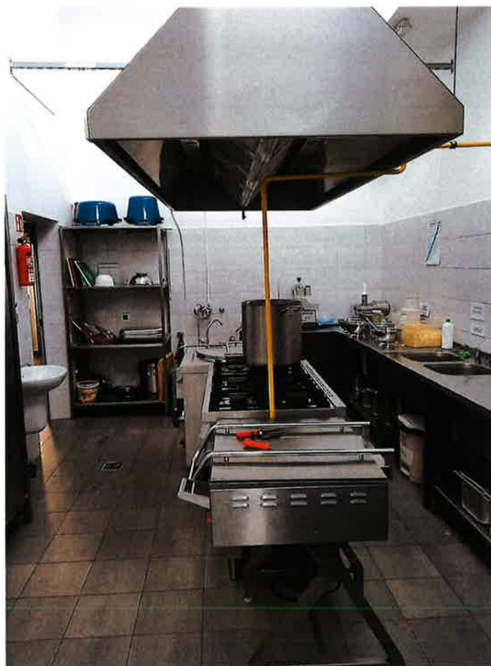
Wyposażenie i montaż urządzeń na kuchni w Zespole Oświatowym w Krześlinie.