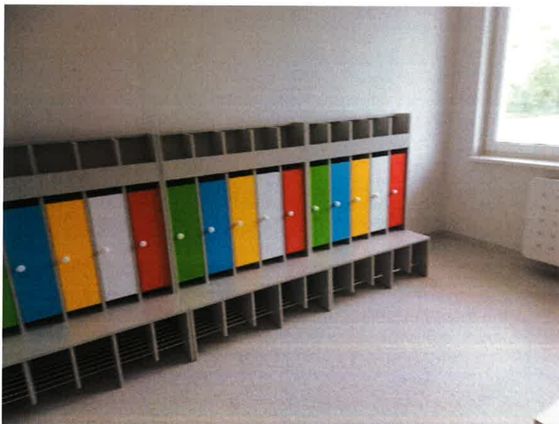
Rozbudowa Szkoły Podstawowej w Krynicy.