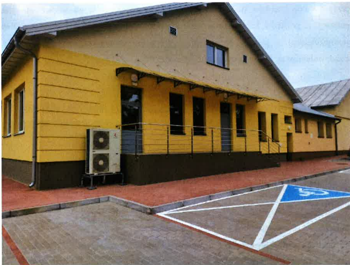
Rozbudowa Szkoły Podstawowej w Krynicy.